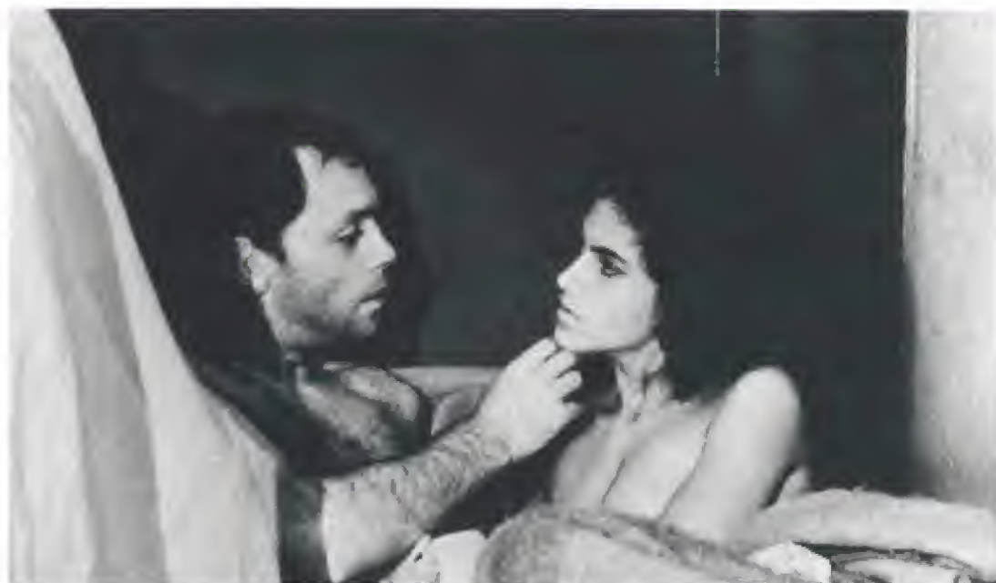
Patrick Dewaere – Clio Goldsmith